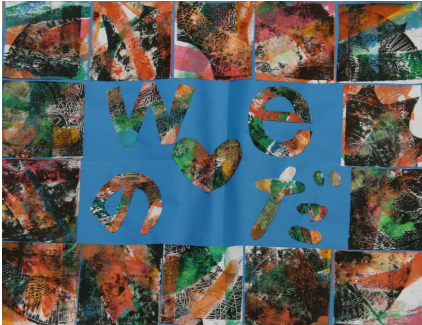
「We ラブ (ハートマーク) のだ」 《スチレン版》