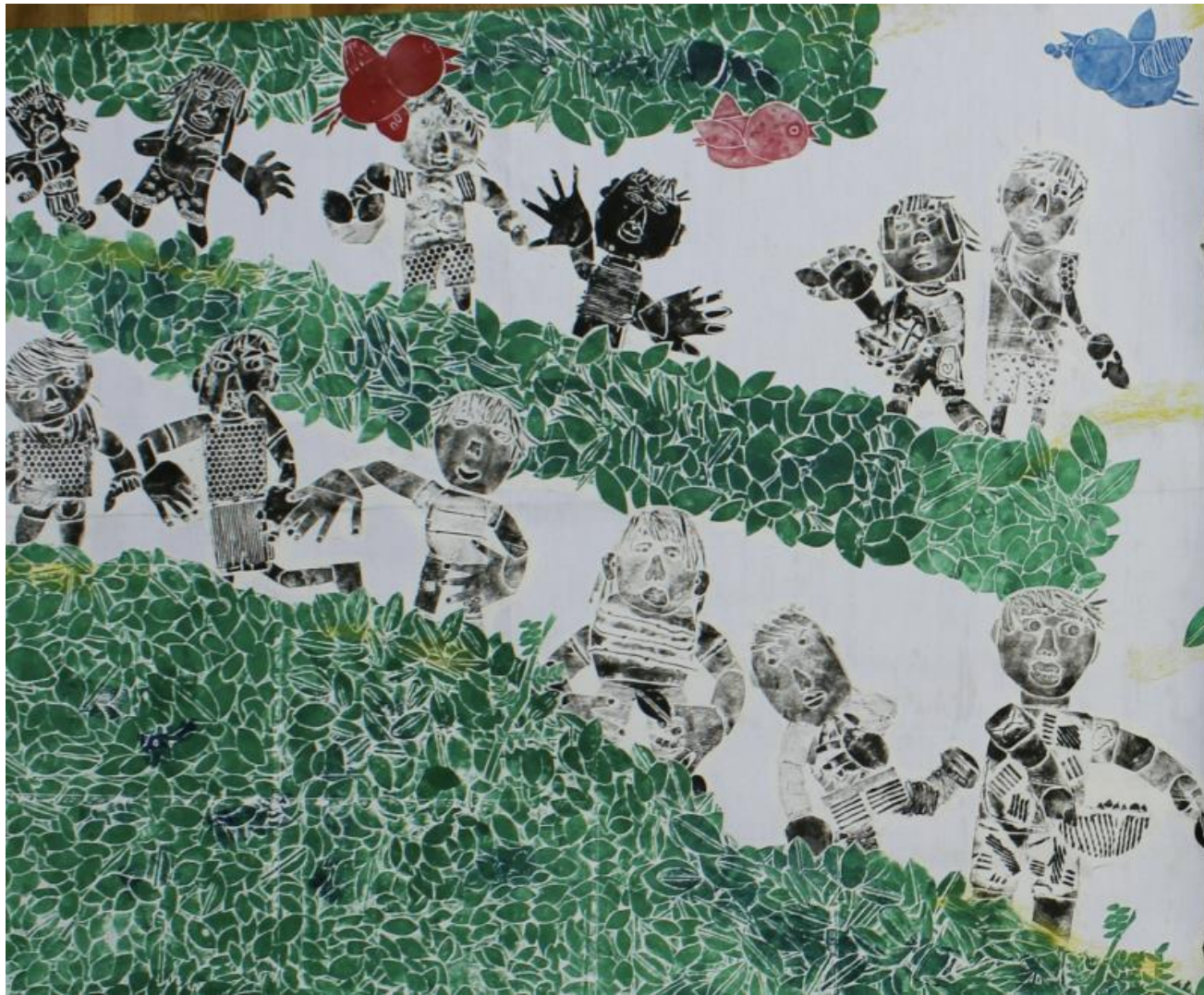
「茶つみ、楽しかったよ！」 《紙版》