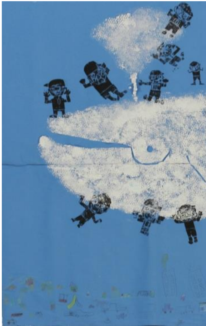
「くじらぐもにのったよ」 《紙版》