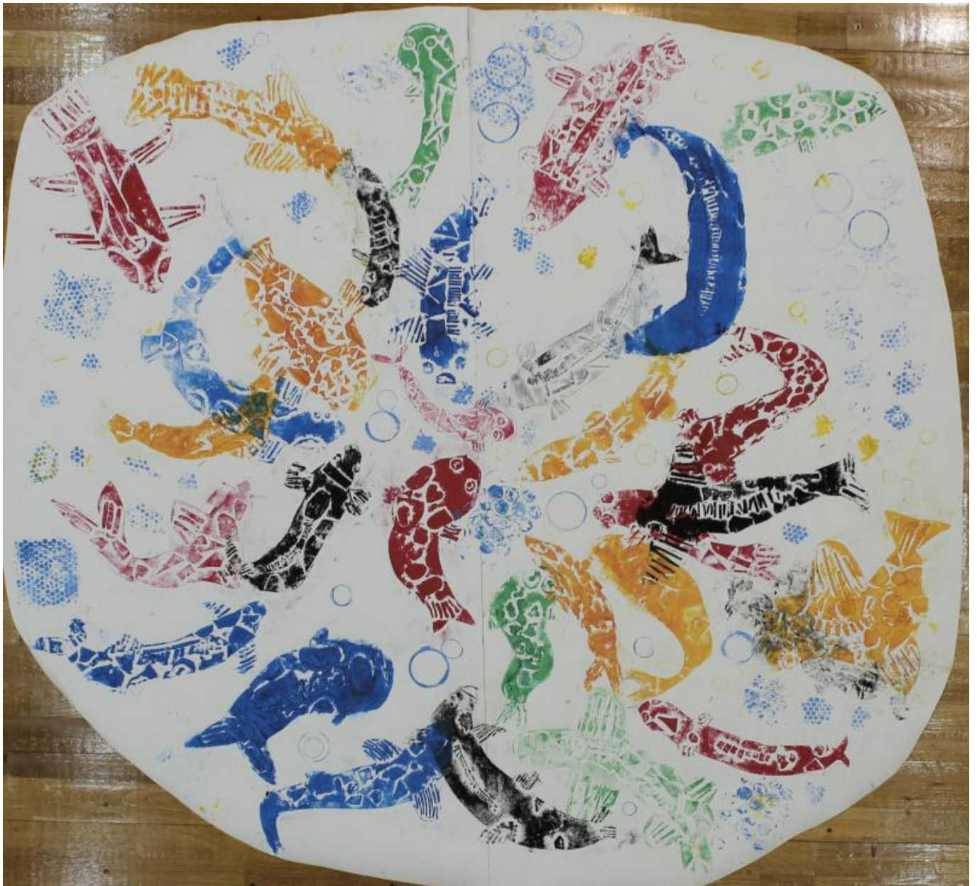
「駅長さっちゃんをさがせ！～生活科見学「こいのおよぐまち」～」 《紙版》