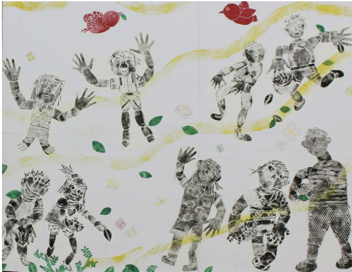
「茶つみ、楽しかったよ！」 《紙版》