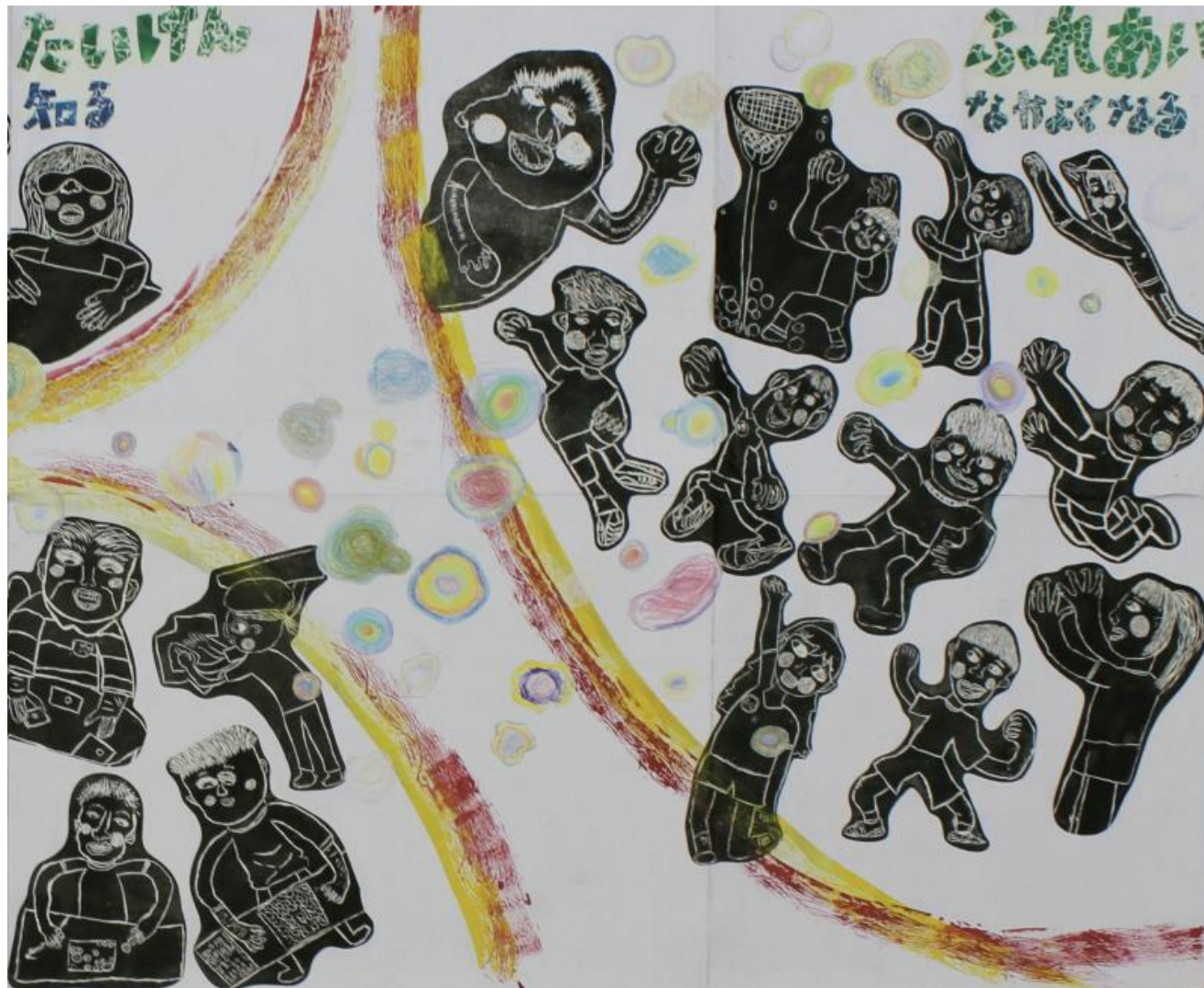
「ぼくたちにできること」 《木版・紙版》