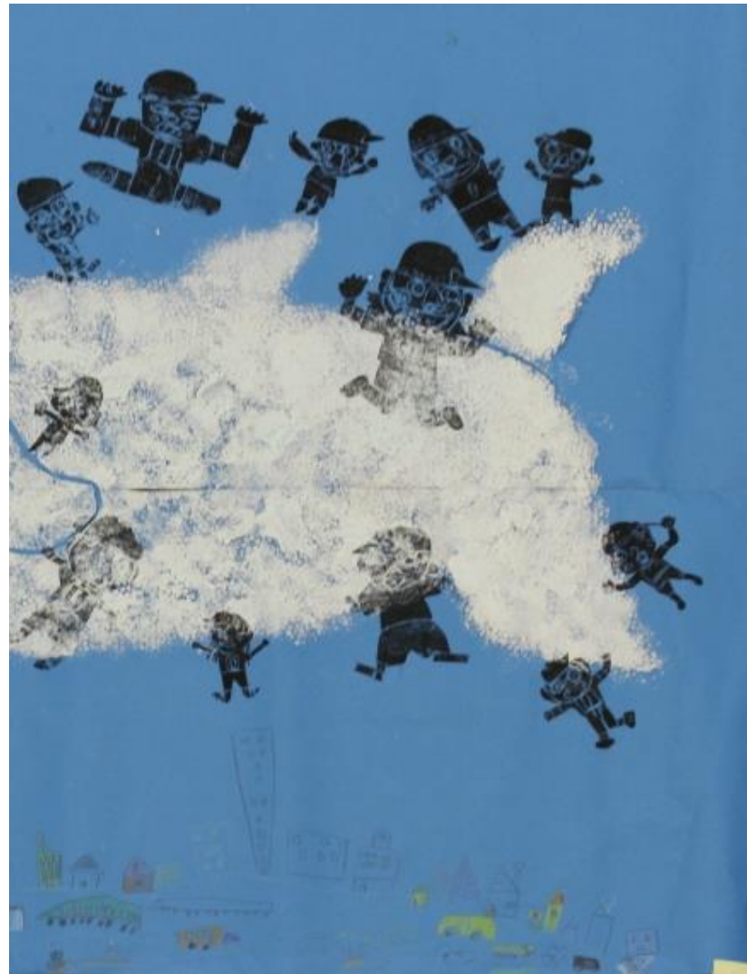
「くじらぐもにのったよ」 《紙版》