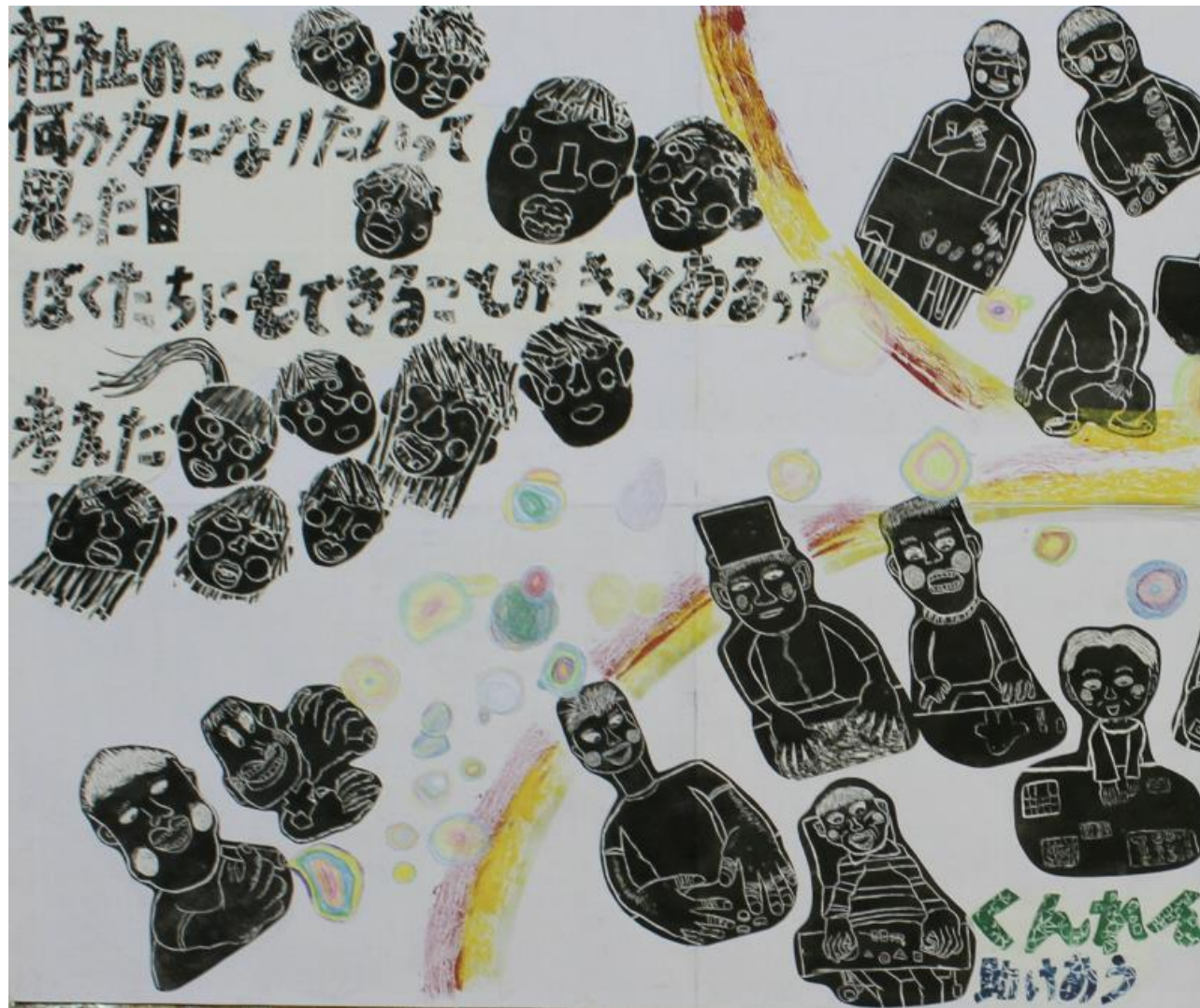
「ぼくたちにできること」 《木版・紙版》