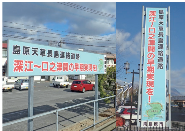
地域高規格道路整備推進看板