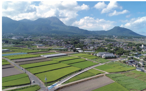
自転車歩行者専用道路整備事業