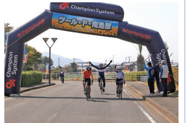
ツール・ド・南島原

農業やそうめん産業などの「地場産業振興」や雇用機会を創出する「企業誘致」をはじめ、世界遺産や自転車歩行者専用道路などの地域の魅力を発信する「観光振興」、地域社会の担い手を確保する「定住・移住対策」といったまちづくりを目指すプロジェクト。