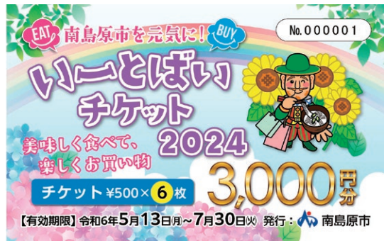
消費喚起クーポン券事業

エネルギー・食料品価格等の物価高騰の影響を受けた生活者や事業者の支援を主たる目的とする事業。