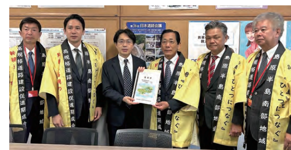
（国土交通省道路局長：左から3人目）