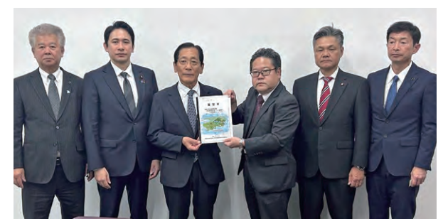
（財務省主計局主計官：左から4人目）