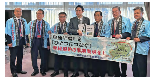
（国土交通大臣政務官：左から4人目）