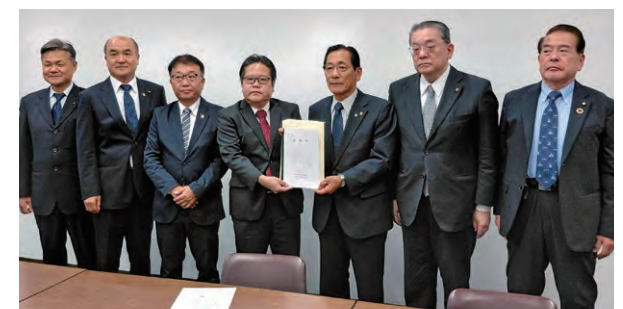
（財務省主計官：左から4人目）