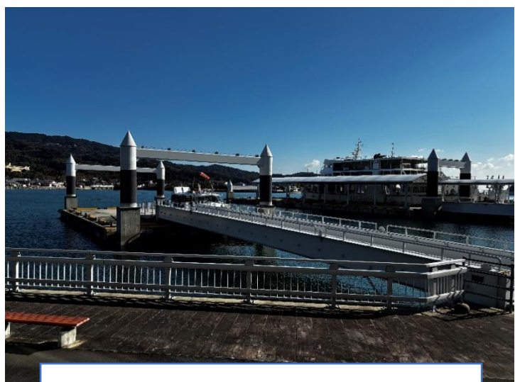
乗船場所: 口之津港緑地公園

口之津イルカウォッチングの協力により、開会式会場からスタート地点までシャトル船を運行します！乗船希望の方は、オルレ参加申込時に同時に申し込んでください。シャトル船の乗船料として、 200円/人 をお願いします。乗船をされない方は、スタート地点まで徒歩での移動となります。