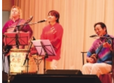
与論島「かりゆしバンド」コンサート