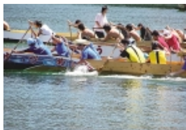
ペーロン大会（マリンフェスタ）