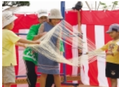
そうめんの手延べ体験

を満たす取り組みを強化し、本市の様々な資源を活用した体験型観光メニューを充実させます。