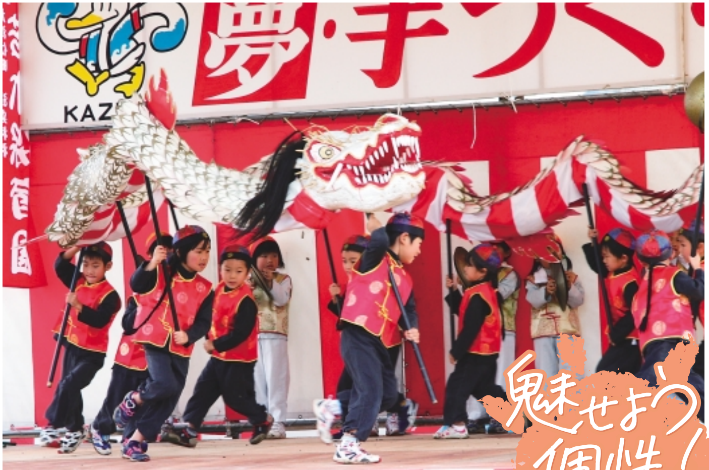
保育園児龍踊り披露（加津佐地区祭り）