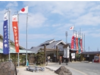
みずなし本陣ふかえ