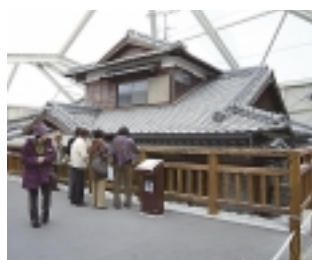
土石流被災家屋保存公園