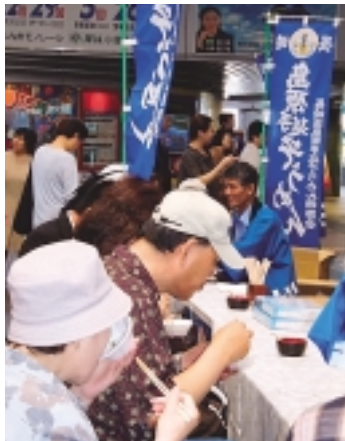
そうめん試食会（福岡市）