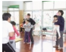
保育園子育て相談