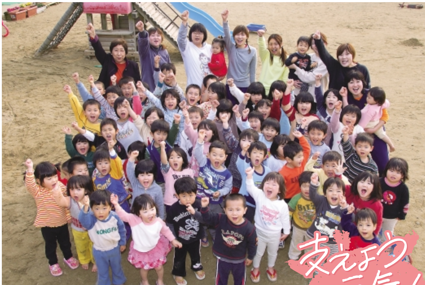
保育園の子どもたち