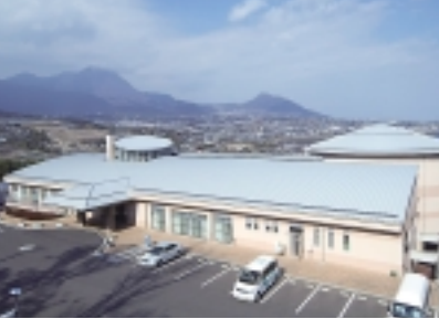
布津保健福祉センター