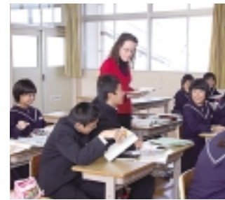
外国語指導助手授業風景

ともにこの地域固有の文化振興策を展開することが重要です。各地域で受け継がれている伝統芸能や史跡等の文化財についてその保護に努め、本市の共有財産として次代へと継承します。