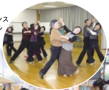
社交ダンスサークル