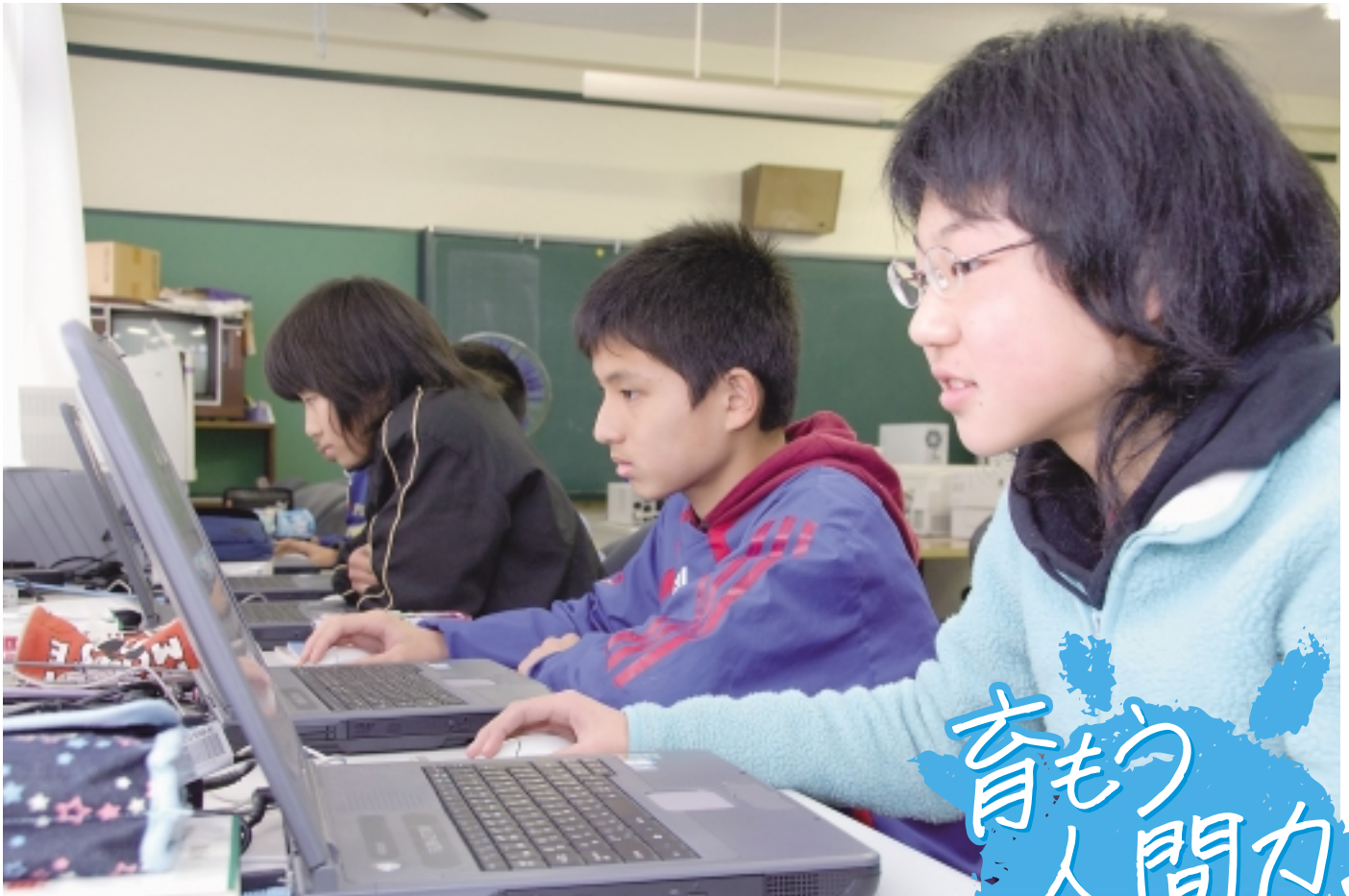
パソコン授業風景