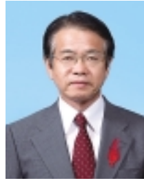
副市長 岩本 公明