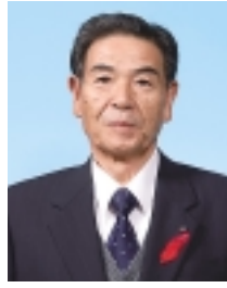
教育長 菅 弘賢