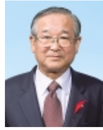
副市長 元山 芳晴