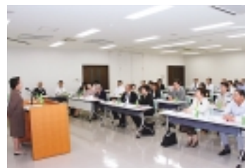
男女共同参画推進懇話会

理解を深めるとともに、保育施設の充実や、男女雇用機会均等法に基づく雇用機会の拡大などの取り組みと そのための 民間活動を 支援します。