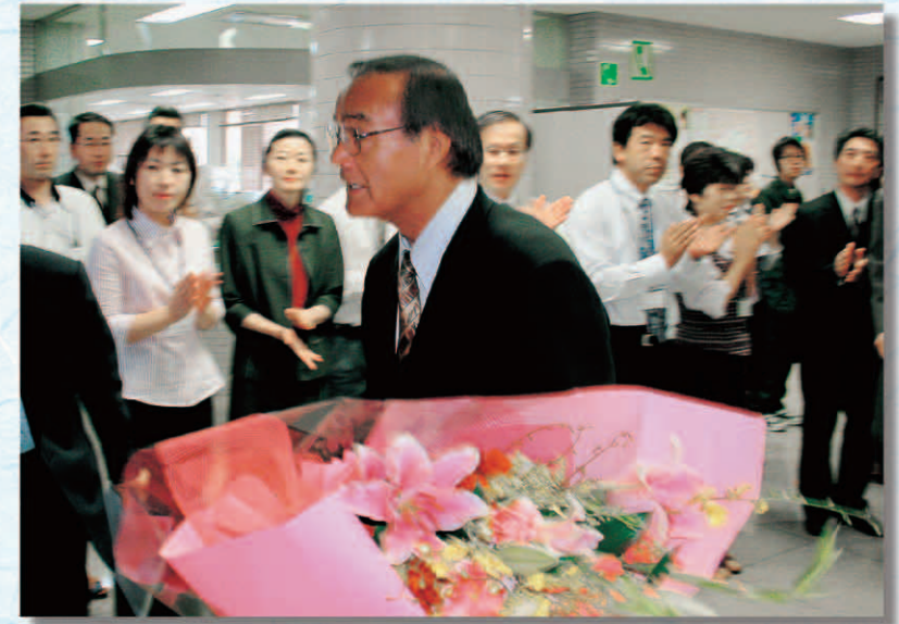
■5月16日、おおぜいの職員に歓迎され、初登庁した松島世佳市長