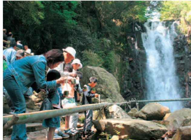
▲名所でのそうめんは格別！