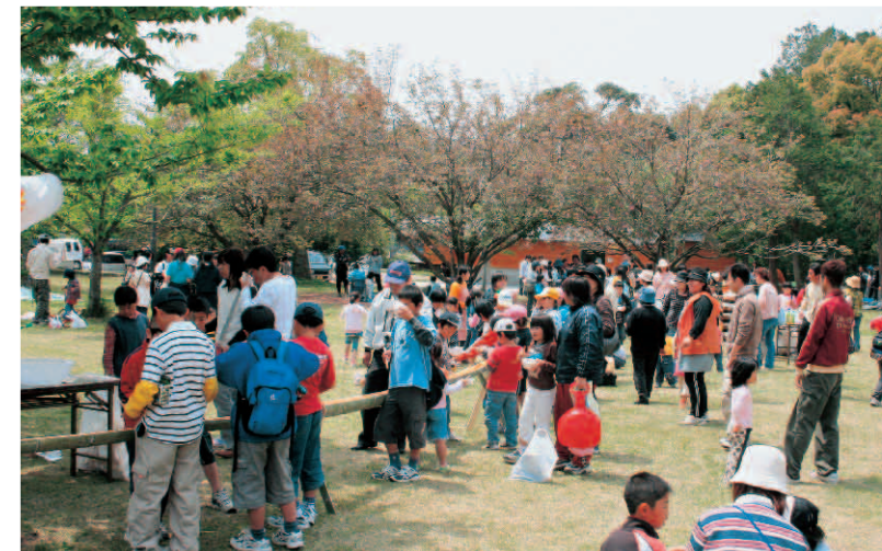
▲全長70メートルのそうめん流し