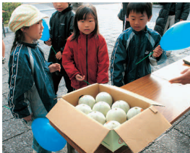
▲おいしそうなおいだね!

直売会はその場で直接送付できる宅配サービスがあることもあり、多くのお客さんが“地元の旬の届けもの”と、福岡や東京方面のあて先を記入していました。