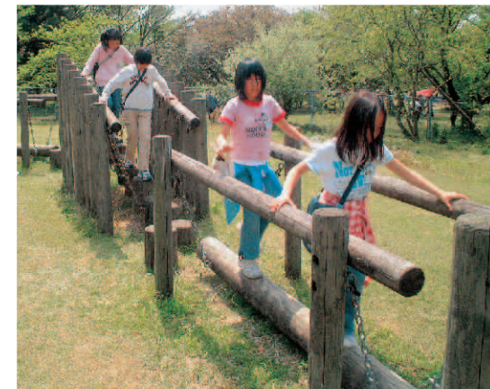
▲楽しい遊具がたくさんあります。