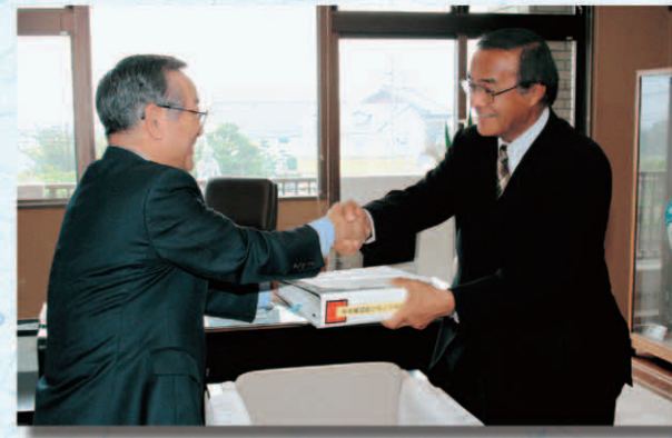
■元山芳晴職務執行者から松島世佳市長へパトントンタッチ