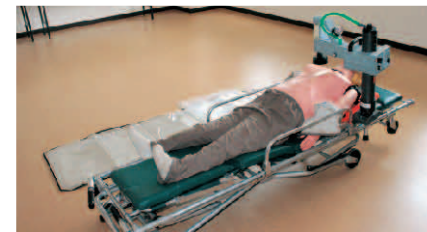
■ 2階 救急訓練室