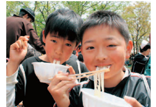
▲おいしいそうめんにっこり