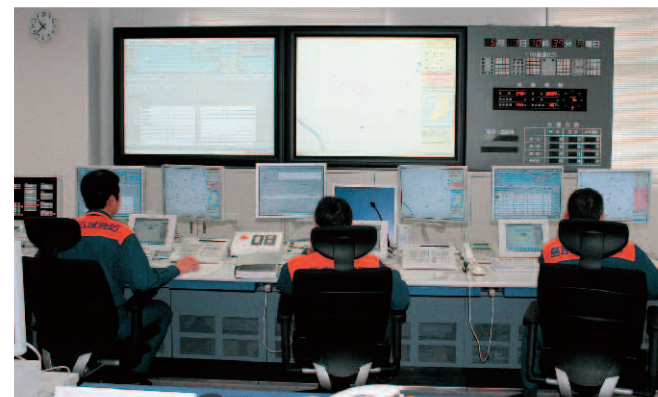
■ 3階 高機能消防指令センター