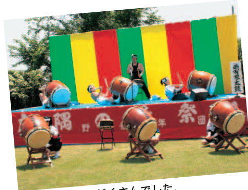
▲出し物も盛りだくさんでした。