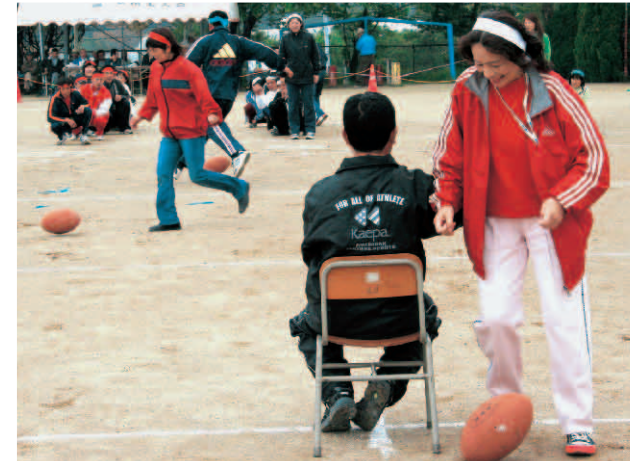
▲そっちに転がらないで!