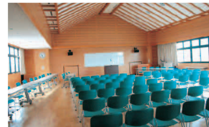
■ 4階 多目的ホール

昭和44年に建築された消防庁舎の老朽化に伴い、移転準備を進め、昨年からは建築されていた新消防庁舎がこのほど完成しました。 新しく誕生した庁舎は、その規模もさることながら、高機能通信指令システムの構築や訓練施設など、内容も格段に充実しています。高機能通信指令システムについては、すべての緊急車両の現在位置を把握しており、それが瞬時にモニターに映し出され、現場に最も近い火災や救急現場へ急行させることにより、到着時間の短縮が期待できます。 訓練施設については、高層ビル火災などを想定した屋外訓練が可能な訓練塔も併設されており、救急隊員の訓練活動に活用されます。また、一般市民の方も申し込みにより、多目的ホールなどで24時間いつでも指導訓練が受けられます。 ほかに施設の地下には100トンの水槽があり、飲料水以外はボーリング水でまかなえるように備えています。