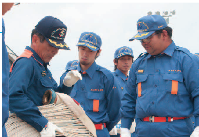
▲真剣な表情で訓練を受ける団員

真新しい消防服に身を包まれた団員たちは、初めての訓練に少し戸惑いながらも真剣な表情で、南島原市消防署隊員の指導を受けていました。