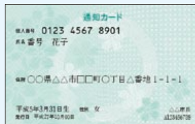
個人番号通知カード(通知カード)

個人番号カードの交付を希望される人は、郵送された通知カードの下部に 付いている個人番号カード交付申請書により、申請を行ってください。