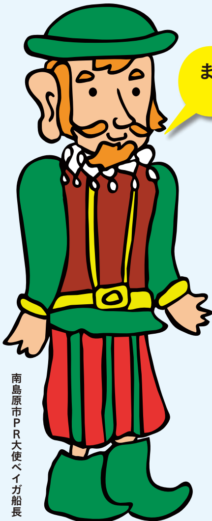
南島原市PR大使ベイガ船長