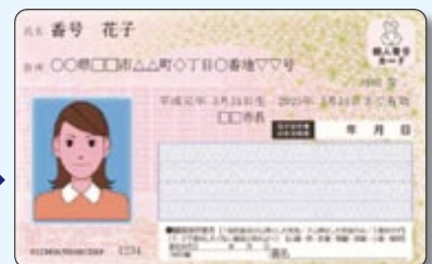
個人番号カード(番号カード)