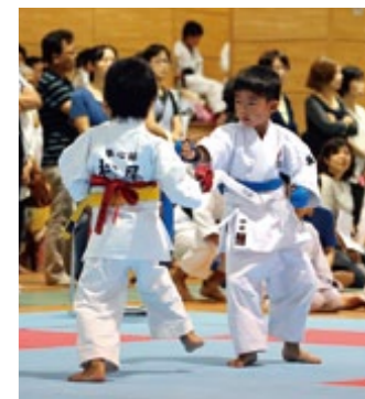
『市民スポーツ大会結果』(5～7) 第10回南島原市市民スポーツ大会