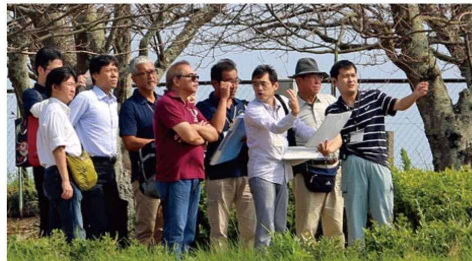
左から5人目がイコモスの調査員