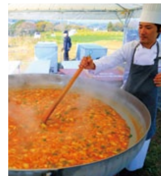
『美味しさ、南向き』 南島原 FoodExpo2015(12)