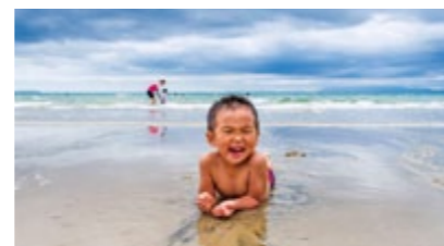
林田拓郎さん作「この広い海独り占め」