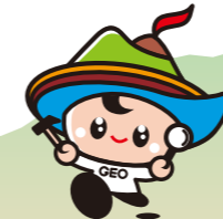
島原半島世界ジオパーク キャラクター「ジオくん」