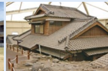
土石流被災家屋保存公園

火砕流で焼き尽くされた校舎や土石流で流され土砂に埋まった家屋が災害遺構として保存されています。