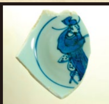
人物が描かれた青花の碗