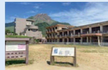
旧大野木場小学校被災校舎