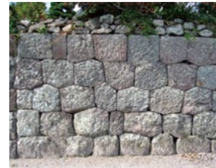
▲武家屋敷に見られる代表的な石垣。 ・下2段が「打ち込み接ぎ・布積み」 ・上3段が「切り込み接ぎ・異形亀甲積み」という積み方。 ・最上段には乱雑に積まれた「つづて石」も乗っています。