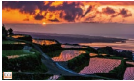
●美しい フランチのお気に入りの場所「水谷棚田」

季節に関わらず、日本料理は美味しいです。しかも、どんなに安くても料理が美味しくなかったという店に入ったことはあまりありません。レストランでは無料でお絞