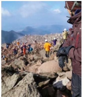
『雲仙普賢岳噴火災害から25年』 特集 いざという時に備えて(5~7)

特に炎天下の中行ったそうめん流しには、大勢の人だかりができ、来場者は冷たいそうめんをおいしそうに味わっていました。