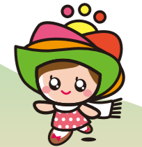
島原半島世界ジオパーク キャラクター「ジオちゃん」