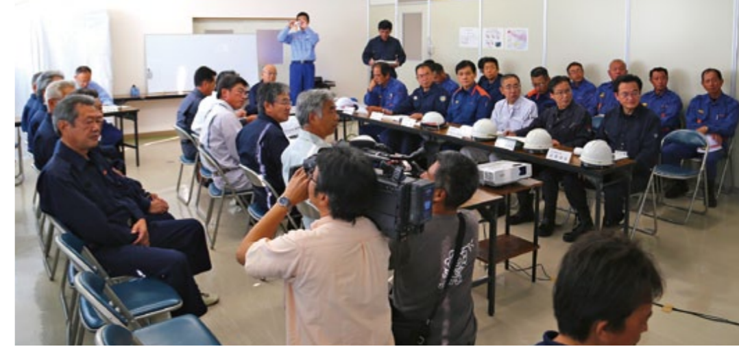
災害対策本部を設置

訓練では、市長を本部長とする災害対策本部が深江町瀬野地区と大野木場地区の住民の皆さんに防災行政無線で避難指示を発令し、それを受けて、住民の皆さんは真剣な表情で避難場所に避難しました。また、避難所では応急救護訓練なども実施し、防災の意識を高めました。