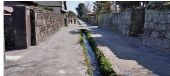
下ノ丁に残る武家屋敷の景観。道の中央に水路を配する町並みが、約400mにわたって続いています。