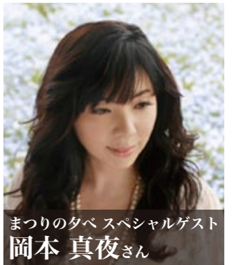
まつりの夕べ スペシャルゲスト 岡本 真夜さん