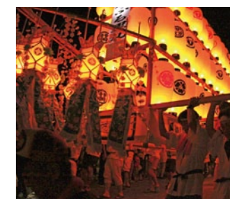
『南島原夏の祭典』 8月のイベント紹介(9)