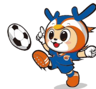
『V・ファーレン長崎 南島原応援DAY開催』(19)