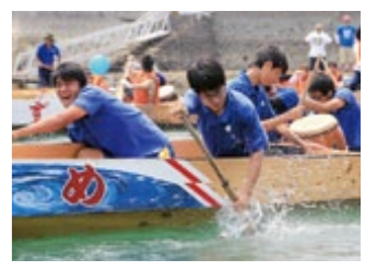
『マリンフェスタinくちのつ』 イベントのお知らせ(21)