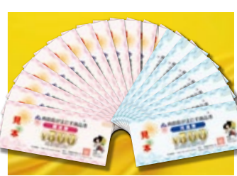
『7月1日より販売開始』 南島原がまだす商品券(15)