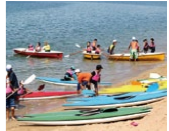
『マリンスポーツフェスタ』 マリンスポーツを楽しみませんか(6～7)