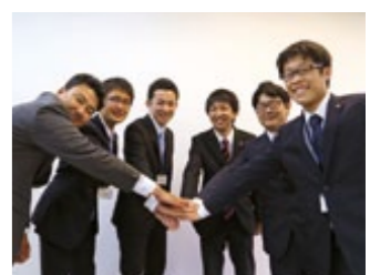
『南島原市職員採用試験』 南島原にゆーす(8～14)