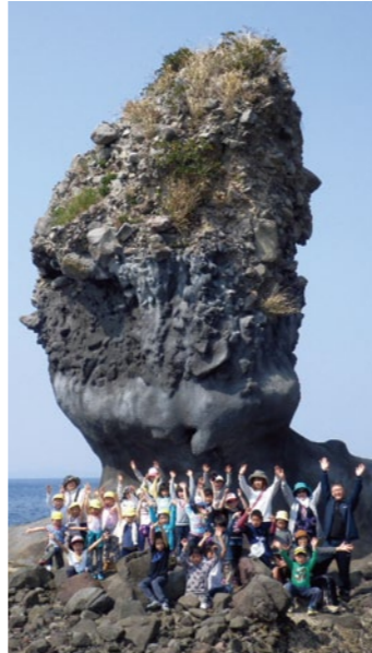
いろいろな大きさの岩石が組み合わさってできている両子岩。

によって削られ、また地殻変動も加わり海の底に沈んでしまい、今はそのすそ野の一部が残っているだけです。両子岩は、かつて島原半島の南西部に大きな火山があったことを今に伝えるシンボルなのです。