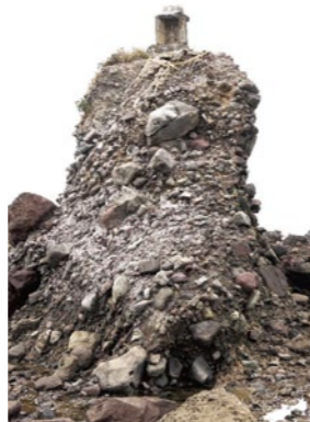
両子岩のわきに立っている祠。二岩神社のご神体です。