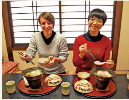
割烹城で具雑煮体験

南島原市に来てから和太鼓をはじ め、書道、茶道、剣道、居合道、よさ こい踊り、弓道などを体験し、積極的 に日本の伝統文化に触れています。