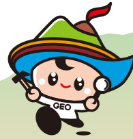
島原半島世界ジオパーク キャラクター「ジオくん」