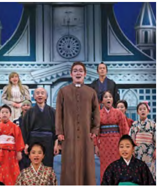
『世界遺産登録支援市民ミュージカル』 特集(6~7)