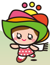
島原半島世界ジオパーク キャラクター「ジオちゃん」