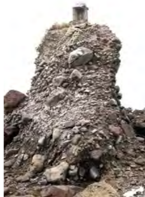
両子岩のわきに立っている祠。二岩神社のご神体です。