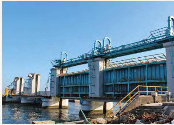
津波で全壊した八幡川水門

津波で全壊した八幡川水門。3月11日の津波への油断につながったのかもしれないと、役場の同僚が話してくれました。