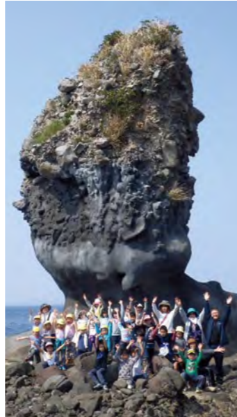
いろいろな大きさの岩石が組み合わさってできている両子岩。

によって削られ、また地殻変動も加わり海の底に沈んでしまい、今はそのすそ野の一部が残っているだけです。両子岩は、かつて島原半島の南西部に大きな火山があったことを今に伝えるシンボルなのです。