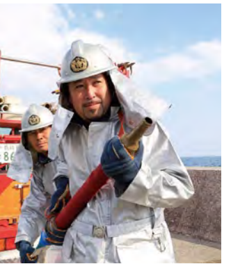
『平成27年南島原市消防出初式』 南島原にゆーす(10~15)