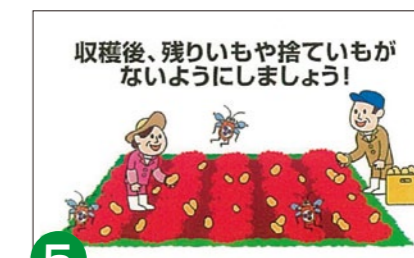
5 畑に残ったジャガイモを拾う