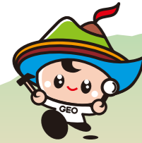
島原半島世界ジオパーク キャラクター「ジオくん」