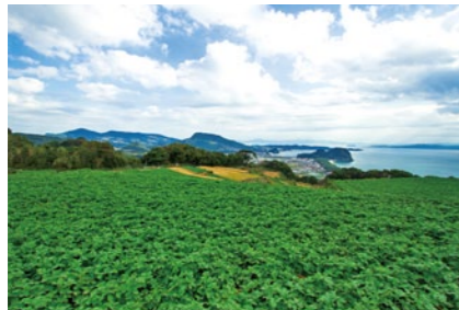
赤土を利用したジャガイモ畑