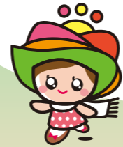
島原半島世界ジオパーク キャラクター「ジオちゃん」