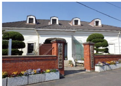
口之津歴史民俗資料館