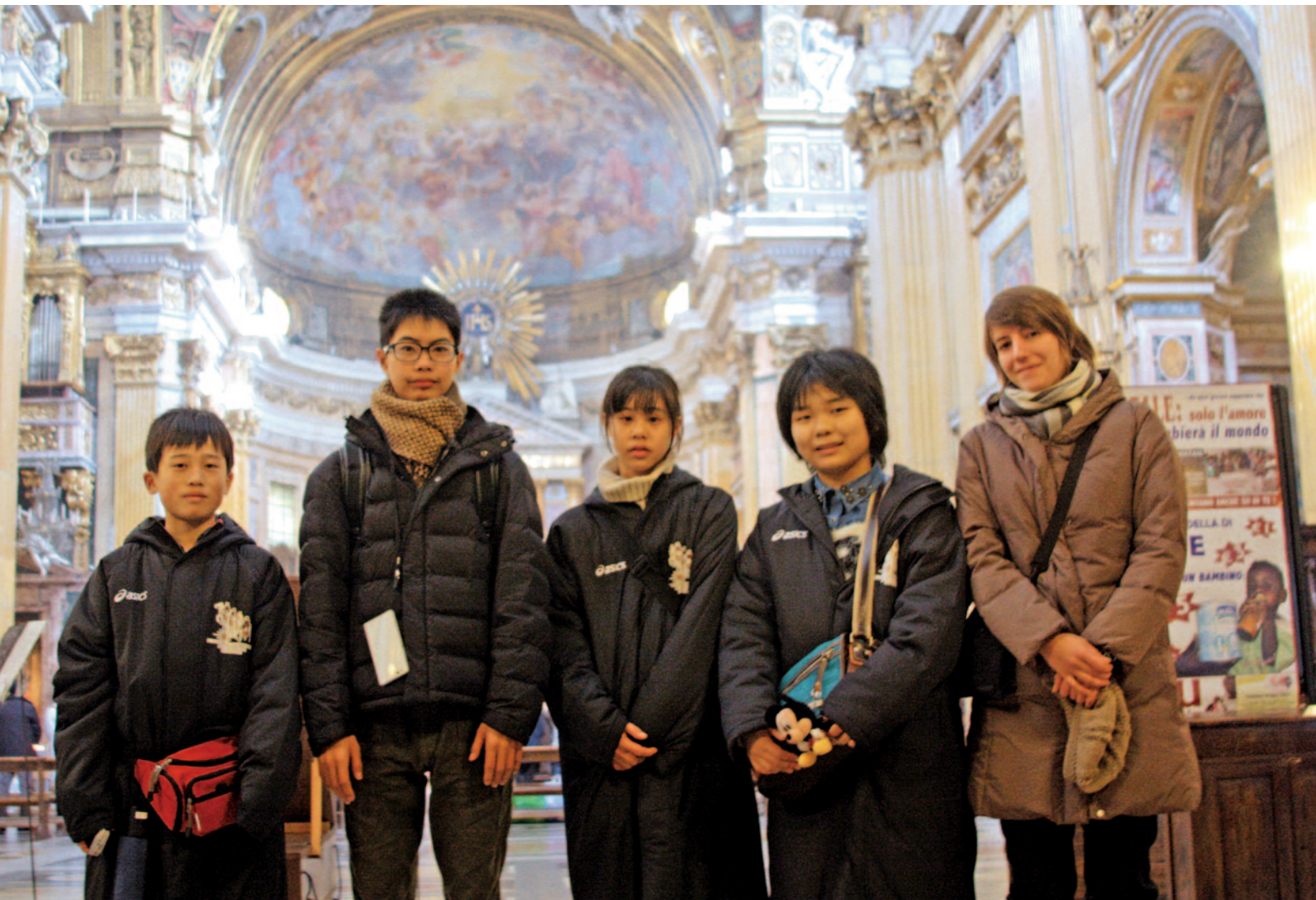
430年前に4少年が訪れたイエズス会のジェズ教会で(ローマ)