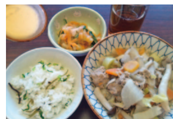
具たくさんふし入り汁、べらべら野菜サラダ、菜めし、ミルクプリン