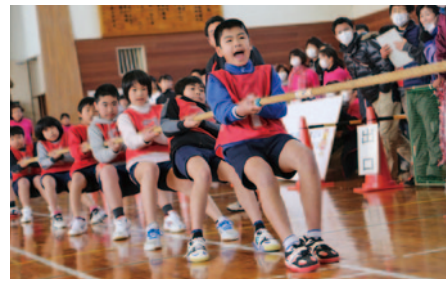
【小学生の部】優勝…古園小