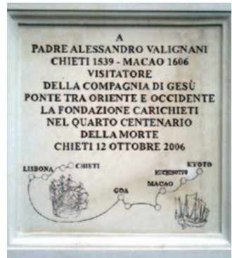
『平成遣欧少年使節ローマに立つ!』 特集(5～7)