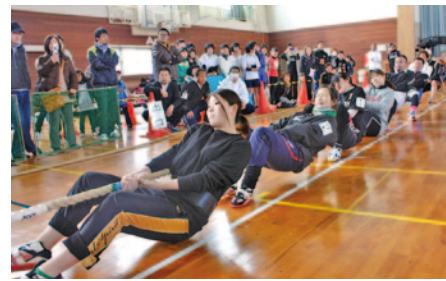
【一般男女混合の部】優勝…桃太郎