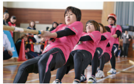
【レディースの部】優勝…じおんじおなご