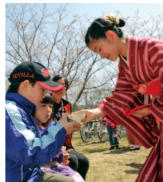
『南島原市桜まつり』 南島原春のイベント(12～13)