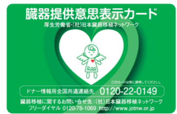
臓器提供意思表示カード表面

全国には、重度の病気となり、移植でしか病気が治らないと診断された人で、移植希望登録をされている人は、約1万3千人います。日本は、臓器の提供者が少ないので、実際に移植を受けることができる人は、年間1~2%です。そのため、海外渡航や生体移植に踏み切る人、移植を待ちながら亡くなる人が多いのが現状です。