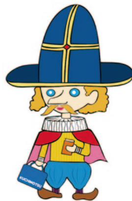
口之津図書館イメージキャラクター リヴロくん 南島原市図書館だより(20)