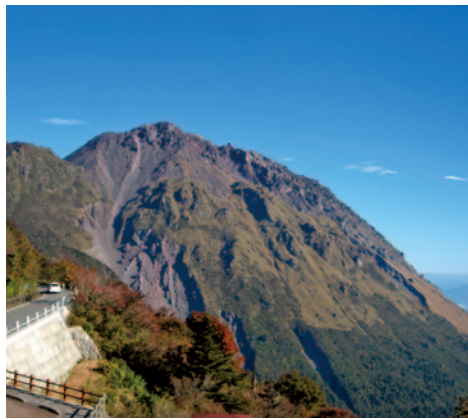
平成新山(仁田峠第2展望所)

今月は、平成新山(溶岩ドーム)と仁田峠を紹介します。平成新山は、平成噴火の際にできた溶岩ドームで国の天然記念物に指定されています。