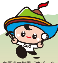
島原半島世界ジオパークキャラクター「ジーオくん」