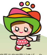
島原半島世界ジオパークキャラクター「ジーナちゃん」