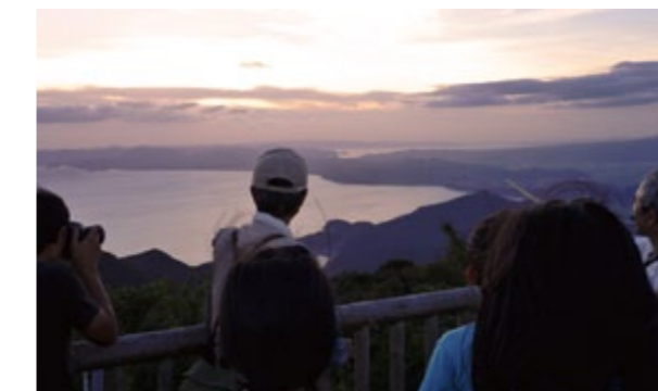
絹笠山からの夕日