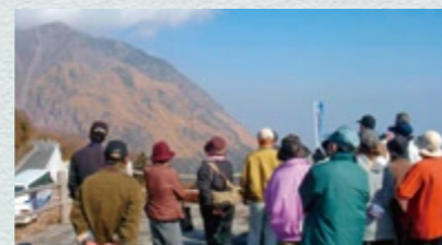
ジオサイトの現地研修(仁田峠第2展望台)