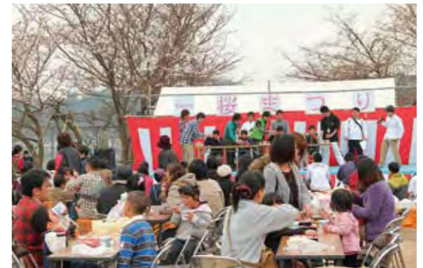
買い求めたお菓子などを食べながら、ステージを楽しみました