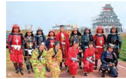
新しくなった一夜城の前にて。新調した衣装で中学生らがポーズ！