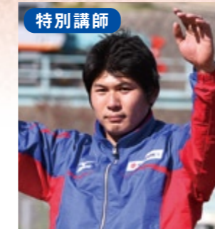
陸上: 2010アジア大会 やり投げ優勝