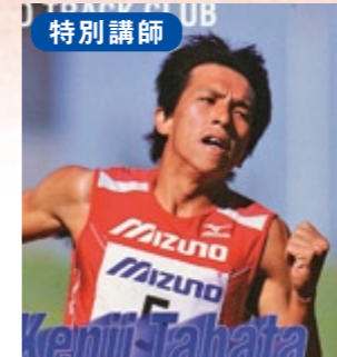
陸上: アトランタ・シドニー五輪 400m