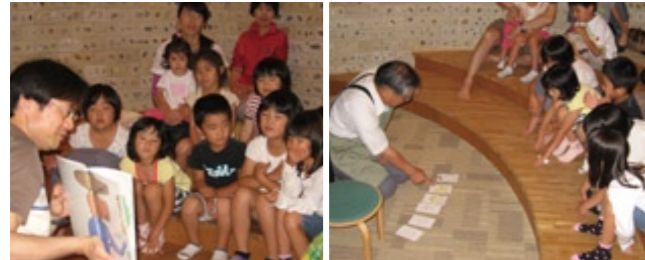
パパたちのお話し会 みんな手品の仕掛けを見抜こうと真剣

私たちが行っているおはなし会の雰囲気とは違い、パパの会を楽しみにして、来館する子どもたち、何よりも、自分のパパがみんなの前で本を読んでくれるという特別感に子どもたちは大喜びです。最近、面白いと、お母さんにも人気です。