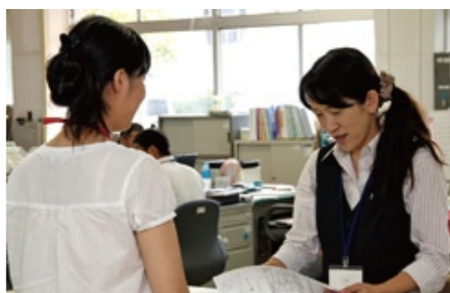
明るい対応を心がけています(北有馬支所)

員の資質の向上、支所機能の充実などに努め、市民の満足できる支所づくりを行っていきます。