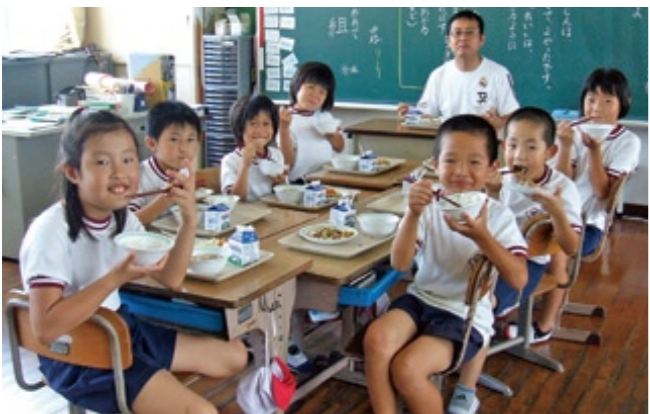
自分たちが育てた玉ねぎの料理を楽しむ白木野小学校の児童。米も南有馬産なのだそうです。

加津佐町の水道については、原水を年1回39項目検査しています。浄水の検査は、毎日検査3項目、毎月検査11項目、3カ月検査26項目、基準検査50項目年1回、農業関係4項目年5回の検査をしています。このように、安心で安全な水であると考えており、その努力を続けていきます。ただ、加津佐地区が、水源に乏しいことは事実であり、水道未普及地区も存在することから、北有馬町から水をひけないか検討しているところです。ただ、私どもの説明不足もあって、現在のところ住民の理解が得られていません。北有馬の皆さんと十分な話し合いを行い、今後問題解決に努めていきます。