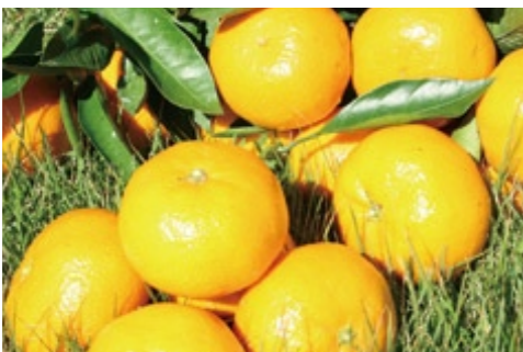
口之津の試験場では、多くの新品種が開発されました

答 今年2月、平成27年度末までに静岡に統合したいという旨を国から聞いたため、5月には、農林水産大臣、国会議員、農研機構に存続のお願いに行きました。農家にとってこうした研究施設が身近にあることはとても重要であり、雇用の場としても重要と考えています。市としても存続できるよう最大限の努力をします。