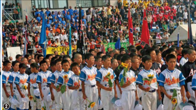
②市の花ひまわりを手に国旗掲揚を見守る選手たち