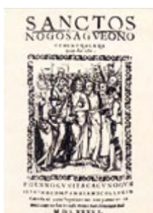
サントスの御作業の内抜書の屏絵

※2キリシタン版とは 天正遣欧少年使節によって持ち帰られた印刷機によって、1590年から1614年の宣教師の国外追放で印刷ができなくなるまで、日本のイエズス会が出版したものを総称して「キリシタン版」と言います。