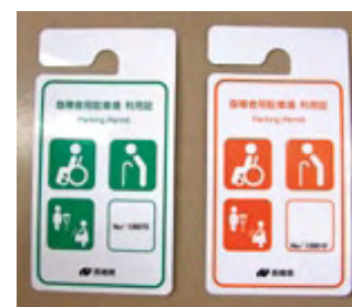
有効期限の年数で色が違います

市民サービス課（西有家庁舎）、または各支所（有家庁舎を除く）で申請を行ってください。 申請時には、身体障害者手帳、介護保険被保険者証、母子健康手帳など歩行困難であることを証明する書類を持参してください。