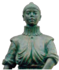
コンスタンチノ・ドラード像 諫早市立諫早図書館蔵

少年使節には、印刷技術者を勉強するために同行した、コンスタンチノ・ドラード（日本名不明・諫早出身）とアグスチーノ（日本名・出身地不明）の2人の日本人少年がいました。イタリアのジェノヴァ共和国やポルトガルのリスボンの印刷所で活版印刷技術を勉強したドラードらは、