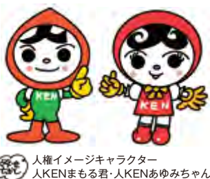
人権イメージキャラクター 人KENまもる君・人KENあゆみちゃん

9月6日(月)～12日(日) 午前8時30分～午後7時 (ただし土・日曜日は午前10時から午後5時まで) 長崎地方法務局 長崎県人権擁護委員連合会 ☎095(820)5982