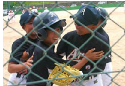
2回戦。同点のホームインに笑顔