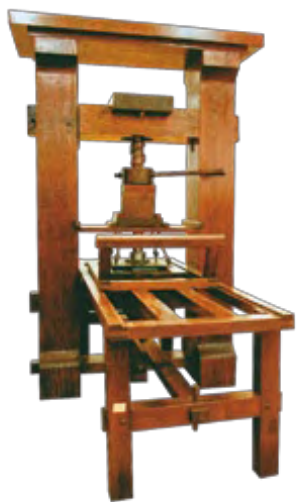
※1 グーテンベルク式活版印刷機とは 1447年、ドイツ人のヨハン・グーテンベルクがぶどう酒のしぼり機をヒントに発明した印刷機で、従来の木版印刷から金属活字印刷へ変わった画期的な印刷方式であった。

持ち帰った1590年当時、は豊臣秀吉の世。1587年のパテレン追放令など、少しずつキリスト教の禁教が進んでいたこともあり、秀吉の目をはばかり、長崎でなく、加津佐の地が選ばれたのではないかと、といわれています。