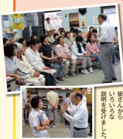
皆さんからいろいろな説明を受けました。

特に、展示されている風鈴に、ふるさとを思い出しました。日本ではあまり見かけませんが、通年中国では今も子どもが公園で風揚げを楽しんでいるのですよ。