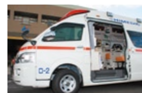
口之津分署に12月から配置された高規格救急車。皆さんの命を高い技術で救います。