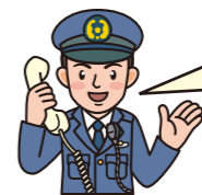
図 南島原警察署 ☎0957(86)2110

事件・事故の際の緊急電話は… 110番 各種相談など緊急ではない要件は… #9110番