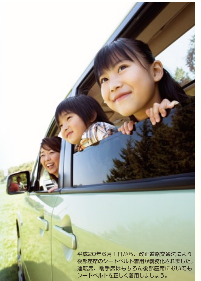
平成20年6月1日から、改正道路交通法により後部座席のシートベルト着用が義務化されました。運転席、助手席はもちろん後部座席においてもシートベルトを正しく着用しましょう。