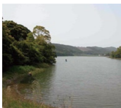
断層地形を利用して造った人工の池

諏訪の池は、1616年に造られた人工の池です。諏訪の池周辺の石は、雲仙火山が誕生する50万年前以前の火山活動によるもので、比較的平坦な地形を作っています。しかし、諏訪の