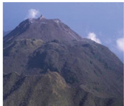
日本で一番新しい山

出ず大災害となりました。高まりは、溶岩尖塔と呼ばれ、根元では今でも火山ガスが出ています。その噴気温度は、19