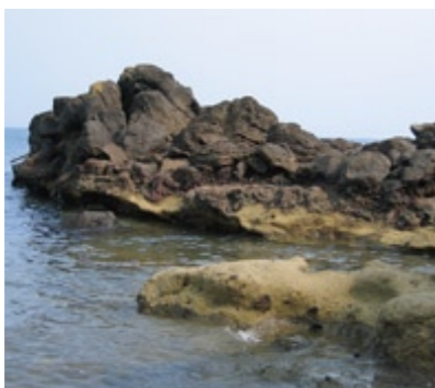
島原半島で一番古い火山活動

島原半島南部では、雲仙火山が噴火を始める前の古い時代の様々な地質がみられます。南島原市口之津町の早崎半島では、島原半島で一番古い火山