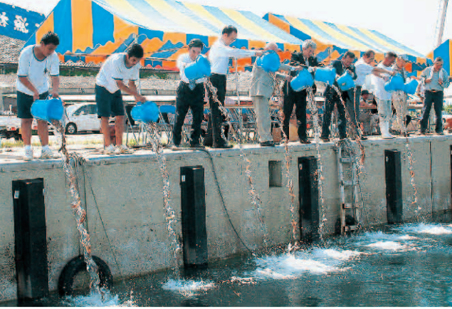
大きくなって帰っておいで▲