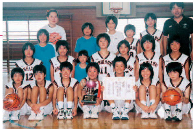
▲南島原市初代チャンピオンの西有家小学校の皆さん