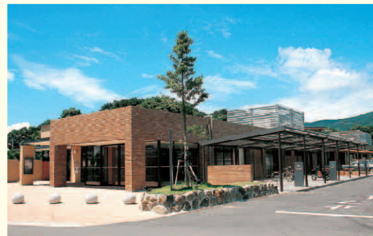
▲平成18年3月開館(市で一番新しい図書館です)

「ごあいさつ」 「リビングライブラリー」を指して・・・ 原城図書館は、今年3月5日にオープンした。南島原市で一番新しい図書館です。図書館は、子どもからお年寄りまで、誰もが「好きなときに」「無料で」利用できる、とても自由な施設です。そして、本は私たちにこのころのゆとりと新しい知恵や知識を与えてくれます。また、図書館は、「本を借りるところ」「勉強をするところ」とのイメージをお持ちの方もいらっしゃると思います。しかし、現在の図書館は、違います。「本を借りるだけ」「勉強するだけ」では、もったいなさ過ぎます。 原城図書館には、新聞が12紙、雑誌は、112タイトルそろっています。新聞を読み比べる。雑誌を選ぶ。インターネットを使用する。