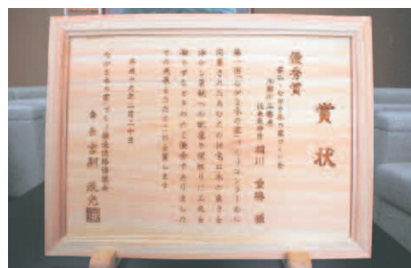
▲ヒノキで作られためずらしい賞状

※墨付け木造軸組み手刻み加工、小舞竹組み土壁工法、内装幻の漆喰塗り、外装漆喰塗り