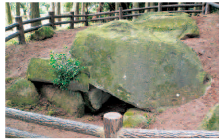
天ヶ瀬古墳-鬼の岩屋