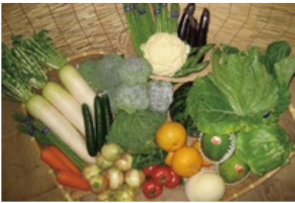
南島原市の地域資源一覧