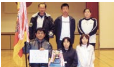
Bクラス優勝 チーム名 わかたか