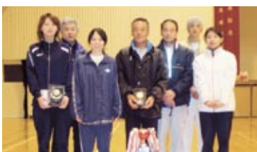
Cクラス優勝 チーム名 ファミリーズ