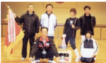
Aクラス優勝 チーム名 パワフル

3月1日(土)、南有馬勤労者体育館で第29回南島原市ナイターミニバレーが開催されました。AからCまでの各クラス別に熱戦が繰り広げられました。「明るくさわやかに」がモットーのこの大会は、幅広い世代の参加者から支持を得ながら年に3回開催されています。真剣さと笑いが同時に楽しめるこの大会は、次回は6月の予定だそうです。