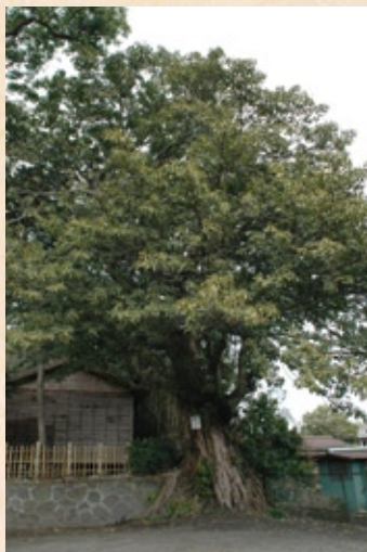
市の木でもある「アコウ」

深江町の氏神である諏訪神社は、深江小・中学校の目前に位置しています。諏訪神社は、信濃国（現在の長野県）上田庄から移住した人によって信濃第一社の大社である諏訪神社が かんじょう 勸請され、正長元（1428）年8月27日に現在の地に祀 まつ られたとされています。社叢 しゃそう は南東を向く本殿の北西側によく発達しており、国道251号線と島原深江道路の交差するあたりではひとさわ目を引きまします。社叢 しゃそう にはクスノキの巨木が7本あり、最も大きいものは目通りが幹まわり6・6mもあり、樹齢は600年といわれています。また、チシヤノキ（目通り幹まわり2m）やハリギリ（目通り幹まわり2・1m）があり、これほどの大木は珍しいものです。市の木であるアコウも見ることが出来ます。 かんじょう 勸請 本社の祭神の霊 たま を他の神社に移して祀ること。