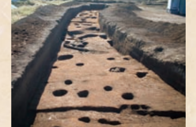
柱穴・溝等の状況

遺跡は布津総合支所から1.5kmほど雲仙方面へ登った市道沿いにあります。遺跡からは縄文時代の終わり頃と、弥生時代の中頃の遺物が主に出土し、柱穴や溝などの遺構も見られました。で、当時の集落の一部ではないかと考えられます。遺跡の場所は緩い傾斜をなす尾根筋で排水に適している点や、北側に雲仙岳、北東から南側にかけて有明海を見渡せる眺望に優れた場所なので、集落の立地としても好条件の場所と言えます。 出土遺物の大部分は土器片ですが、特に注目される遺物として