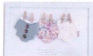
メモリアルボード見本

4日(木) 10:00~12:00 / ベビー服リメイク メモリアルボードづくり (ほっと一息ティータイム) サイズアウトしたお子さまのベビー服は眠っていませんか? 捨てられないからこそ「しまう」から「飾る」メモリアルボードという新しい形でリメイクしましょう!