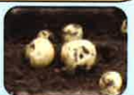
津波見地区だんだん畑