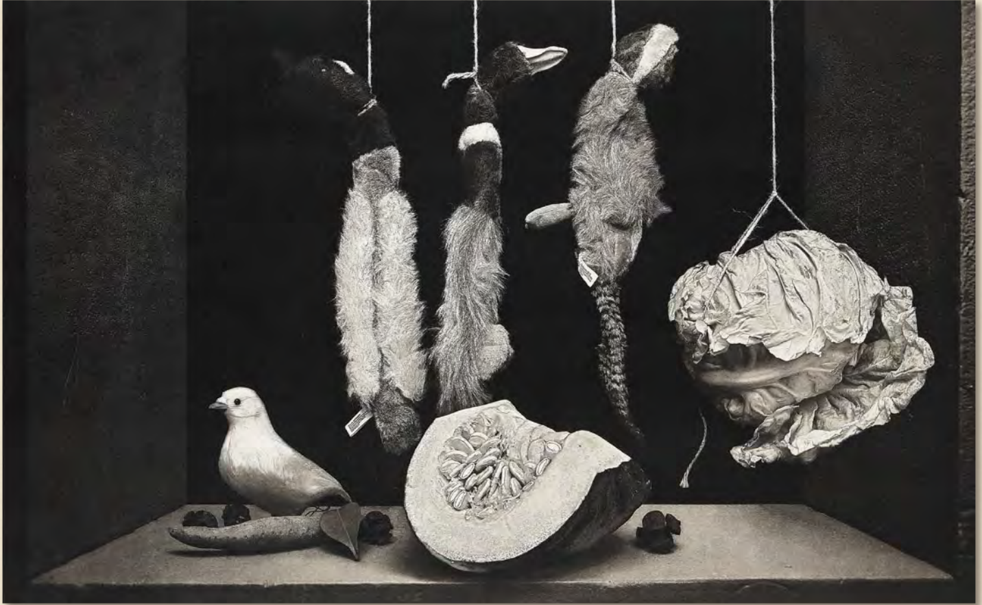
第15回展 第3部門(一般の部)セミナリヨ大賞 《gibier #1》リトグラフ 松田 修(千葉県船橋市)