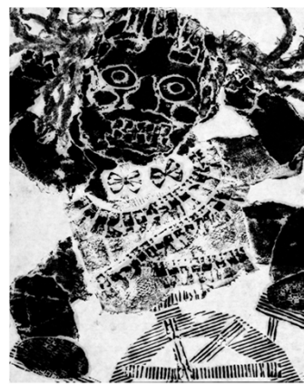
第1部門のセミナーヨ大賞