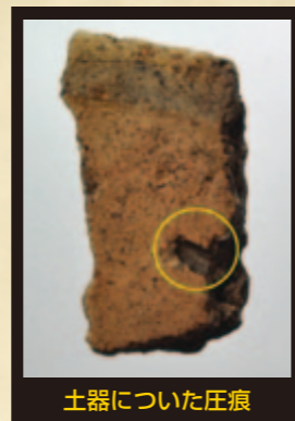
土器についた圧痕

有機物はよほど条件が良くない限り、地面に埋まっている間に分解され、消失してしまうことがほとんどです。だからこそ土器に残った圧痕は当時の生活環境を知る上でとても重要な情報となるのです。