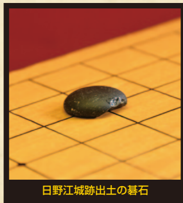
日野江城跡出土の碁石

女城主の碁石の話ではありませんが、発掘調査の出土品は、遠い歴史の生き証人ともいべき存在です。激動の戦国時代、日野江城から発掘された碁石はきっとたくさんの歴史的場面に遭遇してきたはずで、私たちは想像を膨らませることができます。もしかしたら有馬のお館さまが触ったかもしれないこの1点の碁石、ぜひともご覧ください。