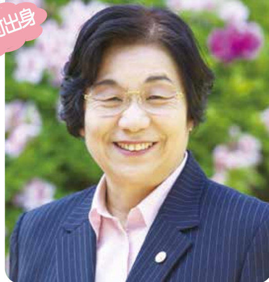
長崎県教育委員教育長職務代理者 前長崎女子短期大学学長