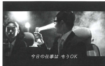
今日の仕事は、もうOK

「プレミアムなお風呂でもっと楽しく休もう!」と提案するこの動画。オリジナルソングのリズムに合わせて、桶を使ったダンスや湯のしぶき、舞い上がるシャボン玉など、総勢70人によるパフォーマンスは見応えがあります。おなじみの「シンフロ」メンバーも登場し、キレのある演技を披露。ドローンによる迫力ある映像やフィナーレの花火も温泉にマッチ