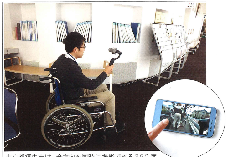
360度映像で見たもの

東京都福生市は、全方向を同時に撮影できる360度カメラを使い、車椅子利用者の目線を追体験できる動画を作成し、公開しています。市役所の駐輪場では自転車をはみ出して止められているためスムーズに通れなかったり、市役所庁舎内では、歩いている人と視線が異なるため、曲がり角でぶつかりそうになったりと、歩行者の目線では気付きにくいバリアが存在することが分かります。