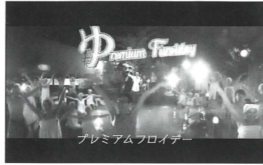
プレミアムフロイデー