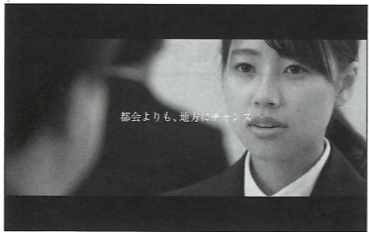
「鬼姫、就活してるってよ」

●岡山県政 PR 動画公式サイト http://www.pref.okayama.jp/chiji/kocho/okamira/