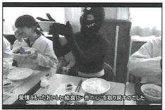
給食の残食量が少なくていいのは、

第3弾のテーマは「給食」。第1弾、2弾に続き、「悪の集団」が小諸に突如現れる。「悪の集団」を引き寄せたのは、学校からの「イー」においだった。「悪の集団」は給食が配膳されている教室にまっしぐら。心のこもったおいしさに感激し、「善の心」を取り戻していく。小諸市では全校に調理場を設置するなど、手際の良い調理により、温かいもの・冷たいものをそのまま食べることが可能に。動画では、小諸市の学校給食の年間残食量が少ないことなどを紹介する。