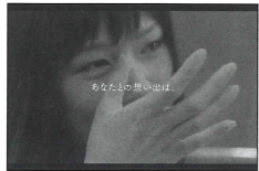
みなとに輝くのは、

▼長崎市 PR 動画「輝きの長崎」(長崎市) 結婚前のサプライズに密着したドキュメンタリー動画。主人公は、長崎市で生まれ育った女性で、結婚を間近に控える。友達に誘われ乗り込んだのは、長崎の新名物・路面電車「みなと」。すると突然、車内に、女性の幼少の頃からの写真や家族のメッセージビデオが流れ、思わぬ出来事に驚き、涙ぐんでしまう。女性には内緒で友達や家族が仕掛けたサプライズだった。そして、到着した島では、もう一つのサプライズが待っていた。動画の最後では、長崎ランタンフェスティバルなど長崎市の見どころを改めて紹介する。